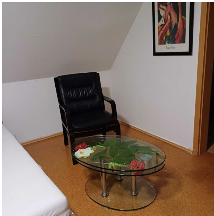
Zimmer 3 OG - 1