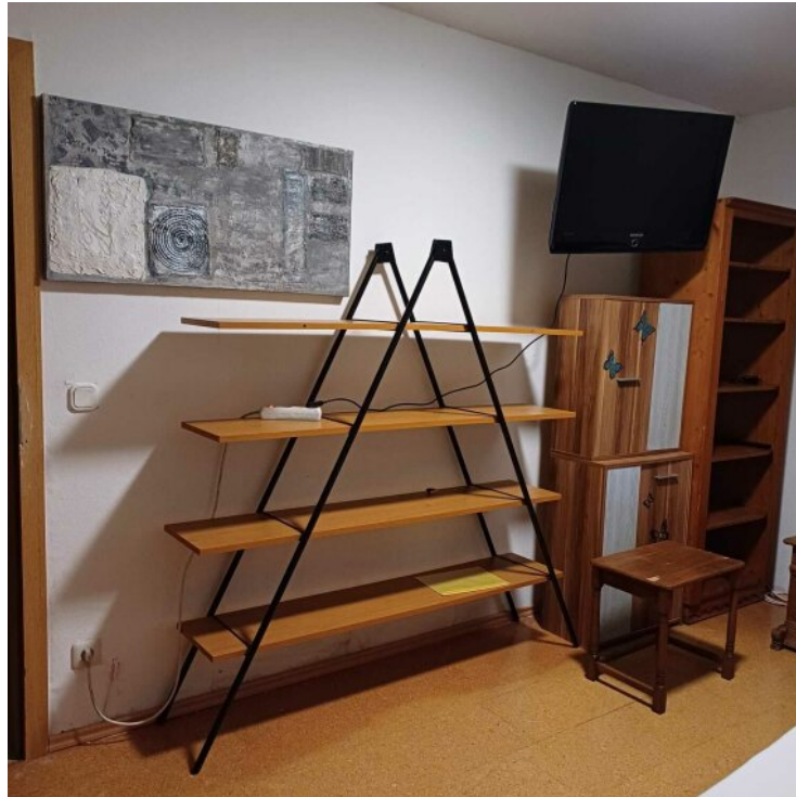
Zimmer 3 OG - 3