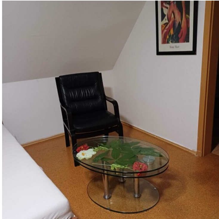
Zimmer 3 OG -1