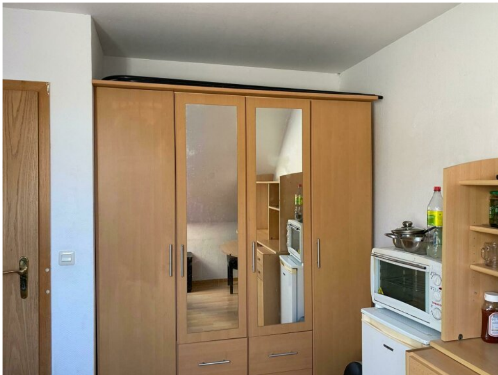
Zimmer 2 OG - 4