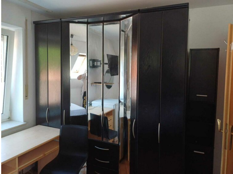
Zimmer 2 OG - 1