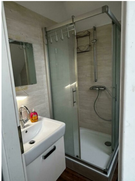
Bad DG -1