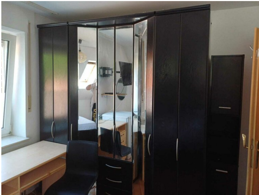
Zimmer 2 OG -1