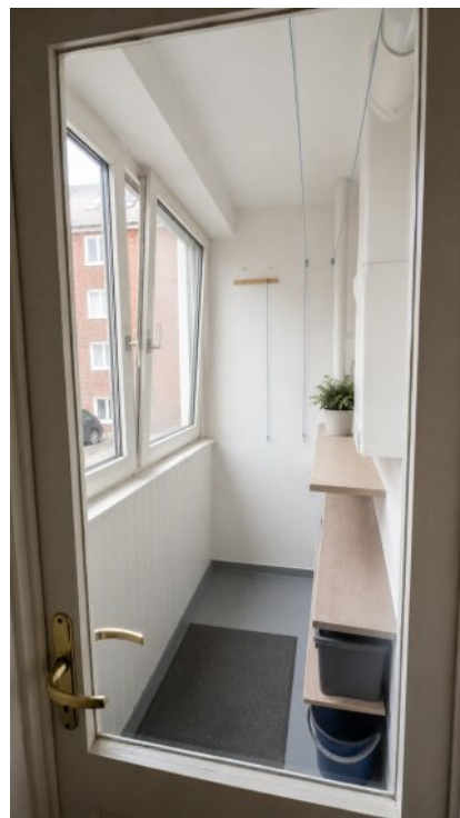
Balkon mit Loggia-Charakter