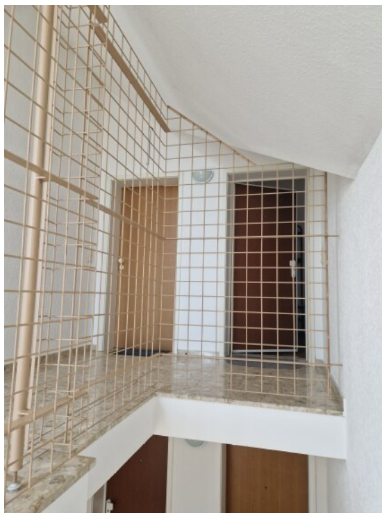
Hausgang / Flur