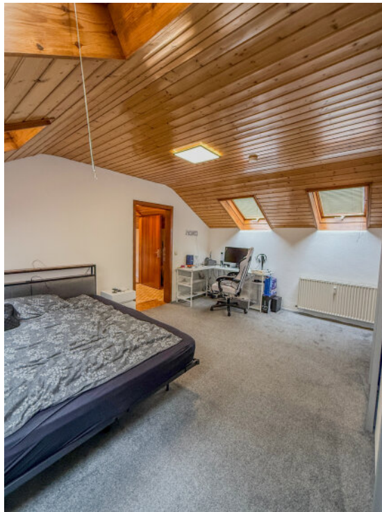
Schlafzimmer / Büro