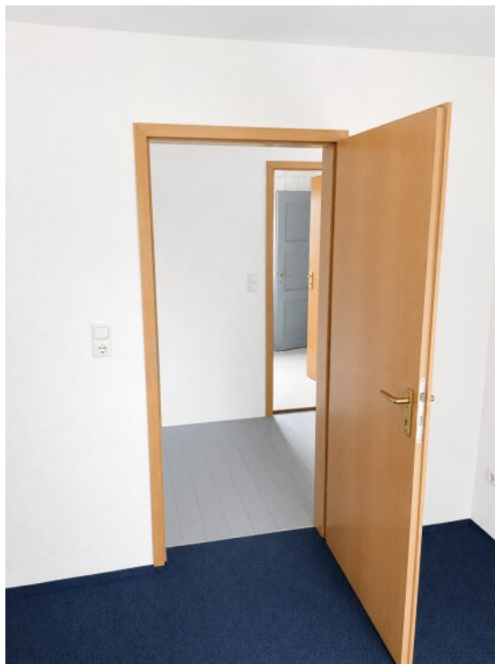
Schlafzimmer Ausgang Flur