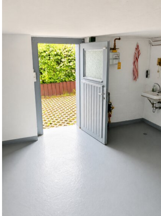
Keller Zugang Garten