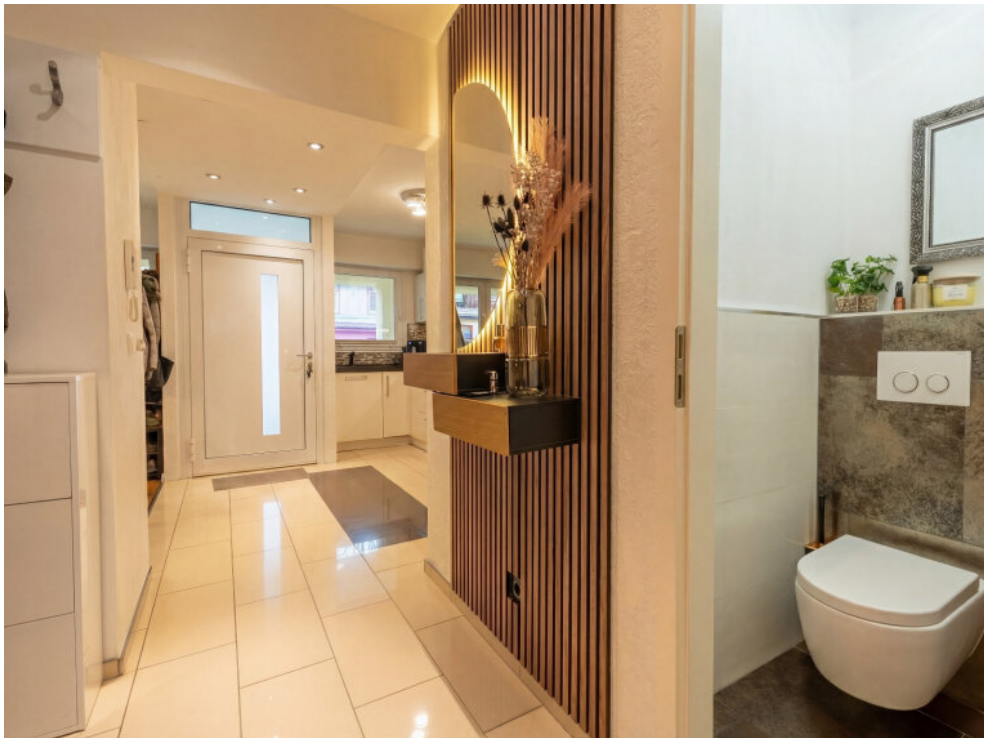
Gäste-WC EG / Flur