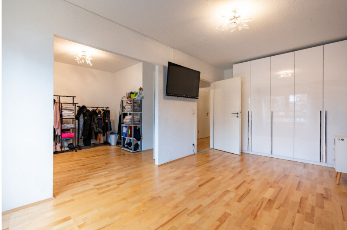
Schlafzimmer mit Ankleide