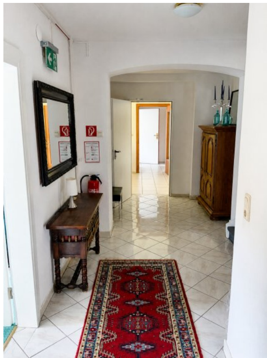
Flur zu Zimmern