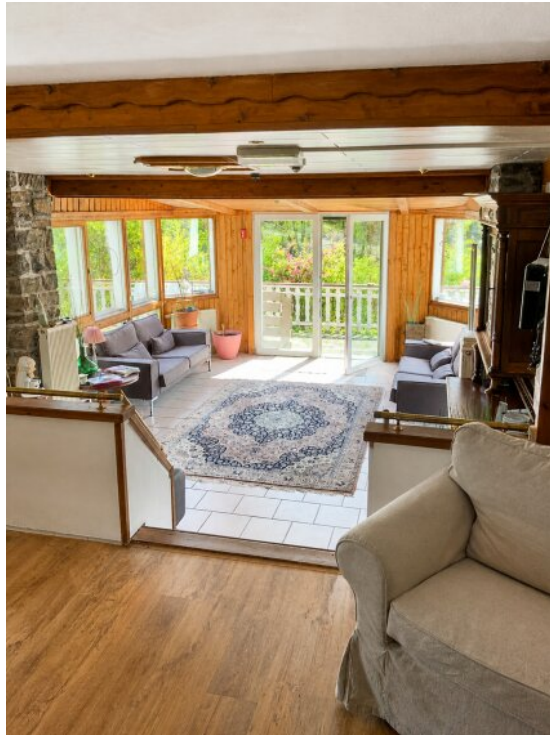
Lobby Ausgang auf Terrasse