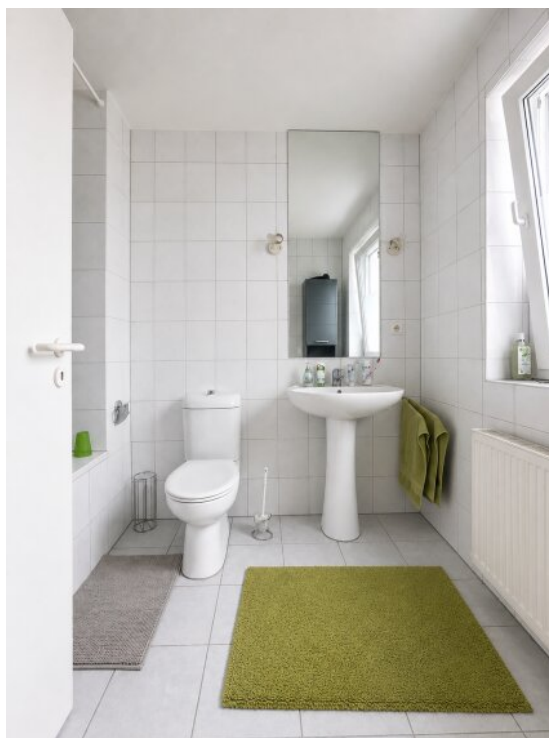
Bad en siut