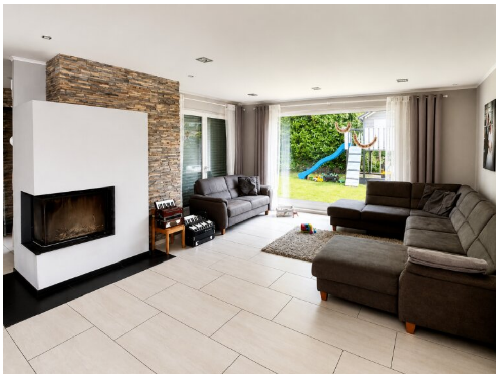
Wohnbereich mit Terrasse