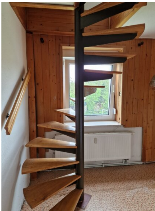
Wendeltreppe zu Zimmer 4