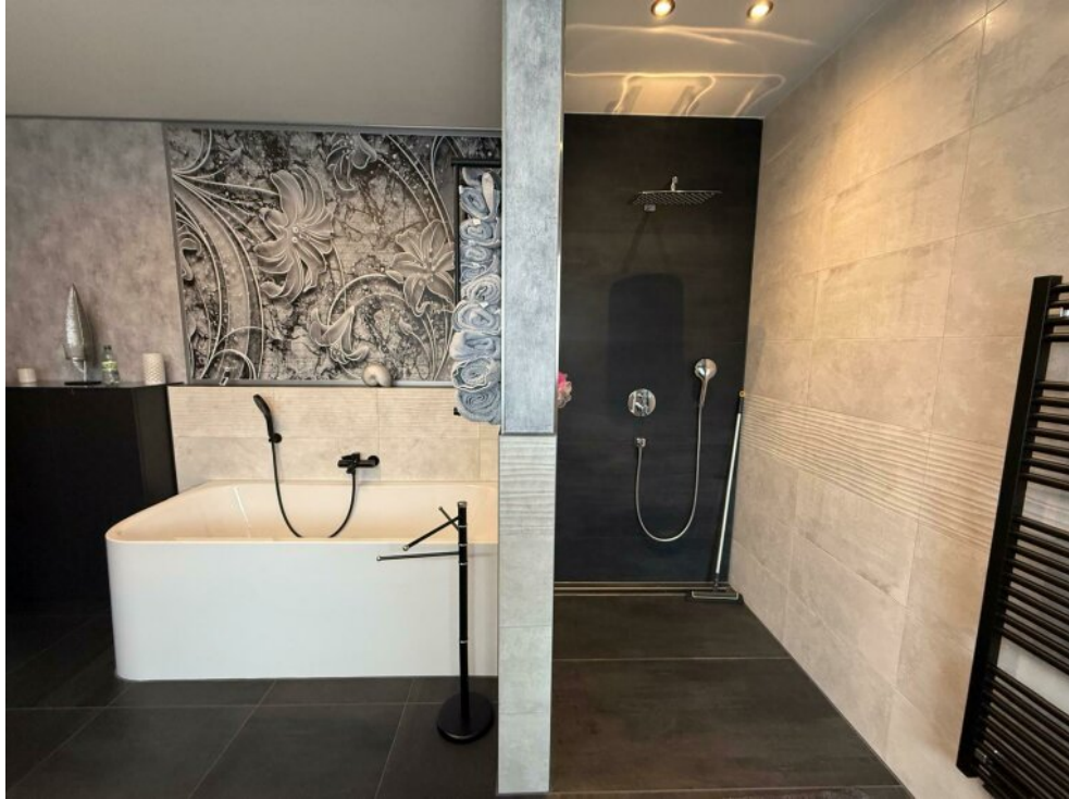
Wanne und Dusche