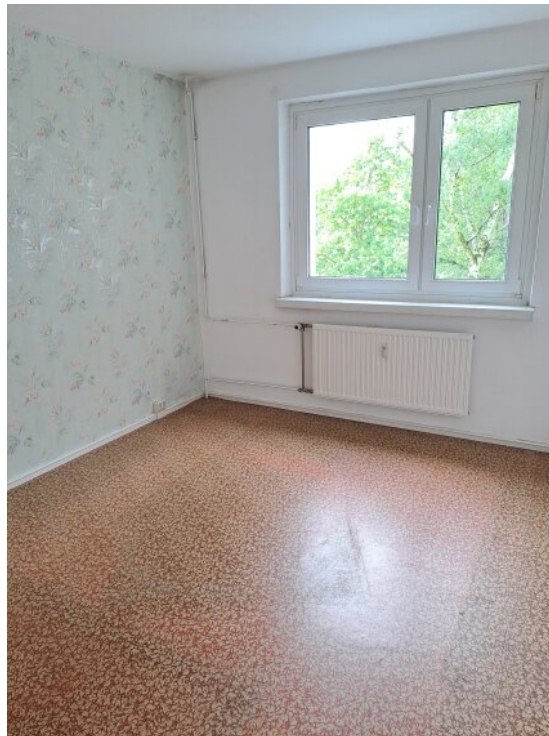
2 Schlafzimmer zum Innenhof