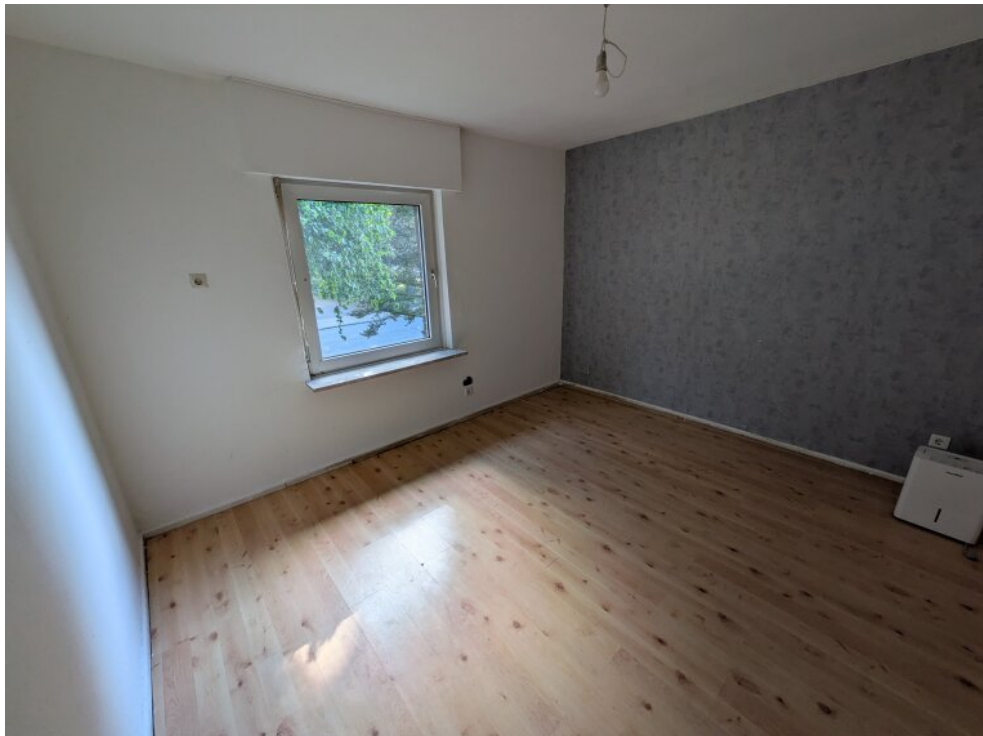
Einfamilienhaus Zimmer 4 OG