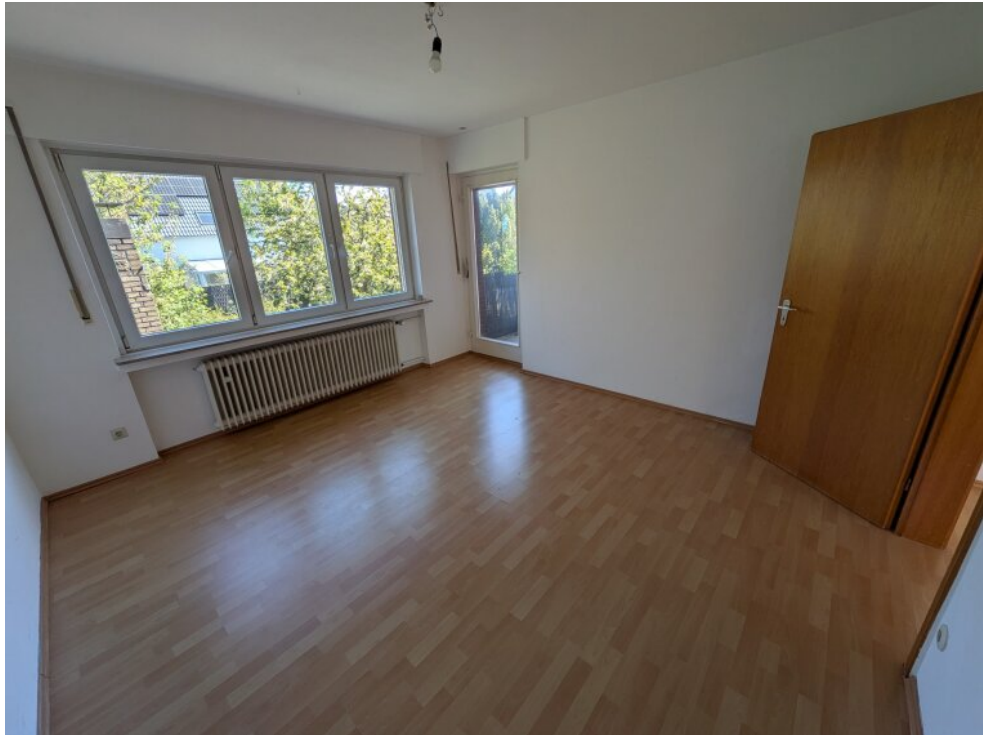
Zimmer 1 1OG_2