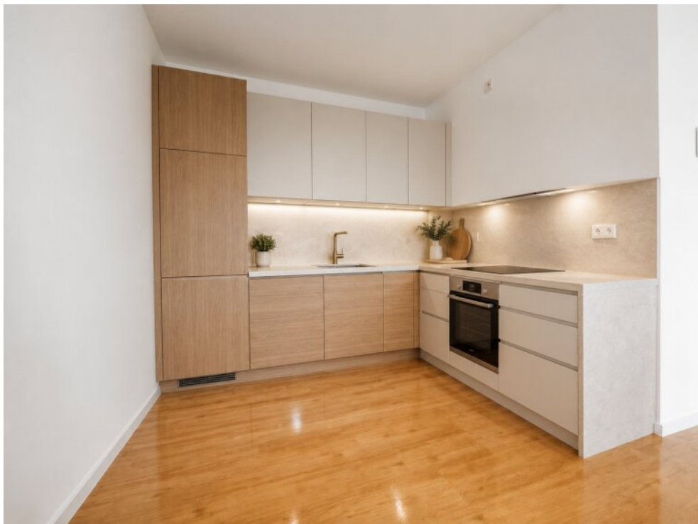
Musterbeispiel einer Küche