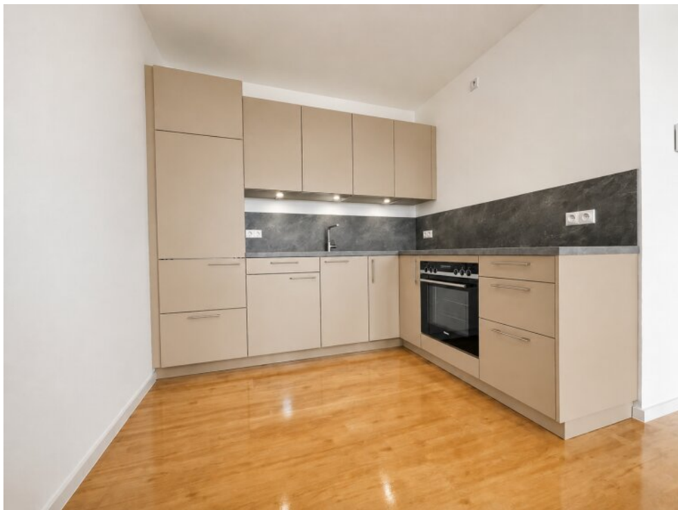
Musterbeispiel einer Küche