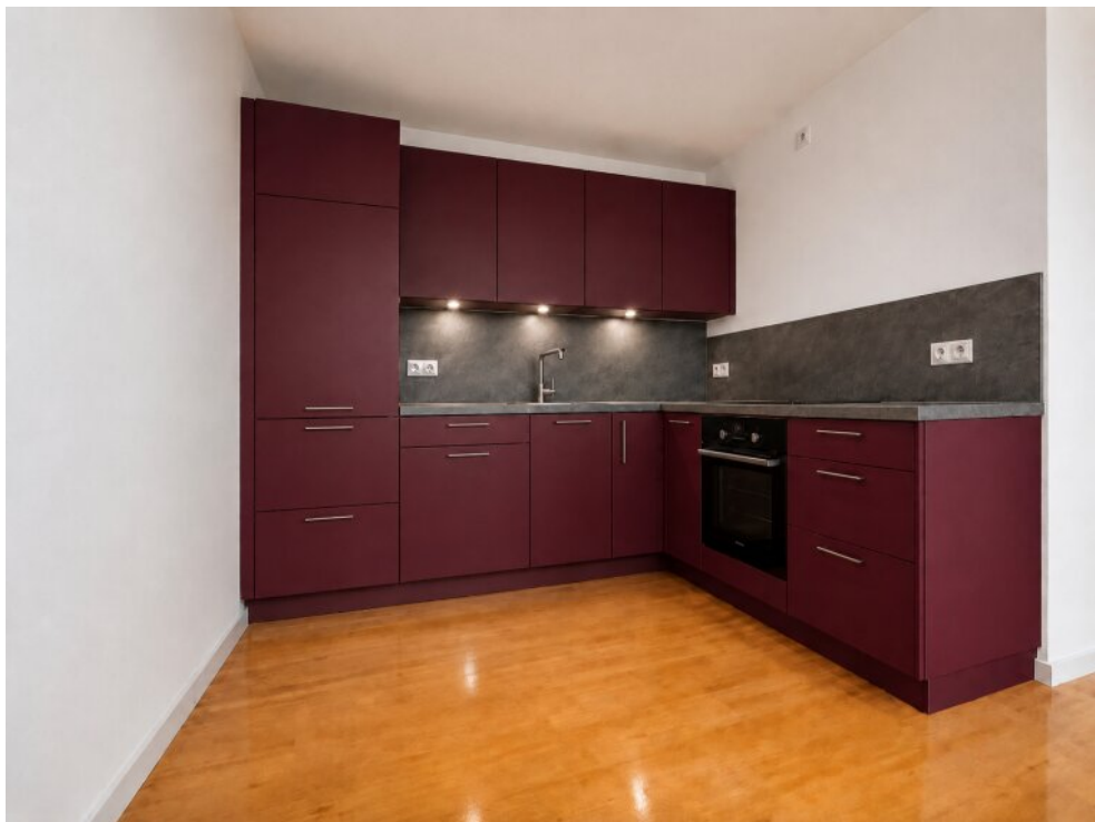
Musterbeispiel einer Küche