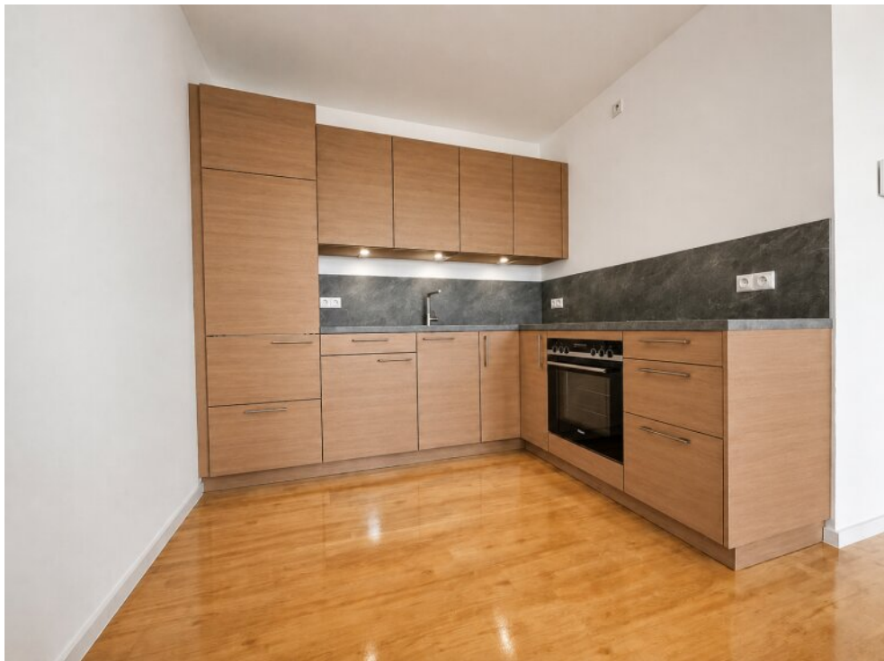
Musterbeispiel einer Küche