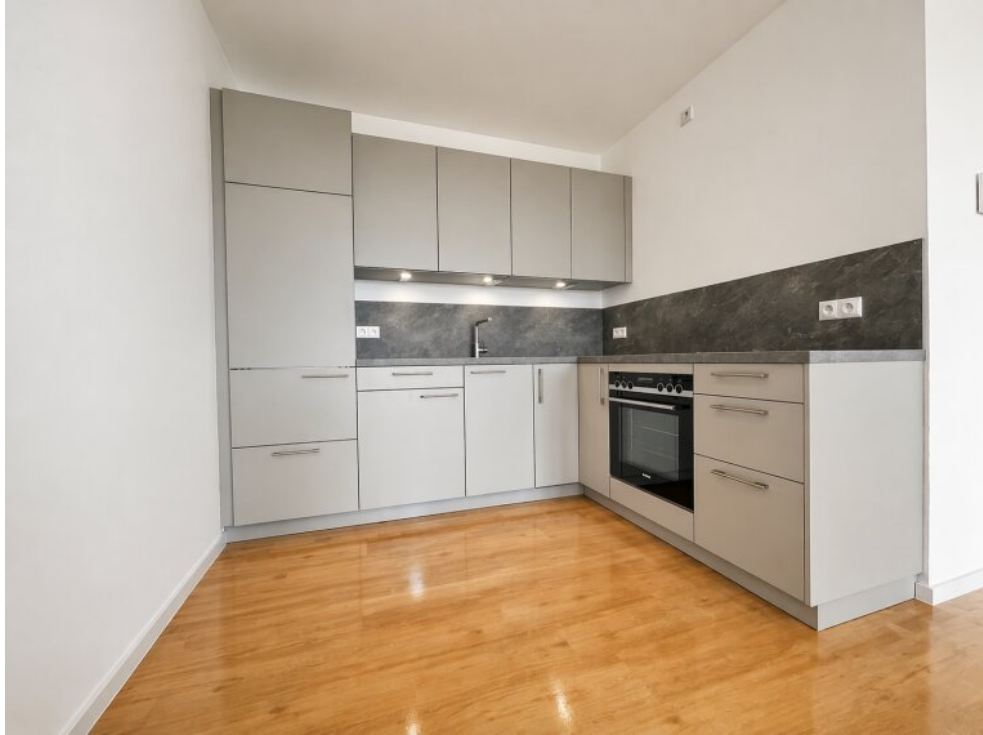
Musterbeispiel einer Küche