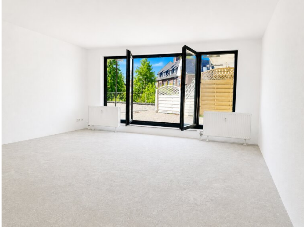
Wohn-Schlafzimmer mit Terrasse