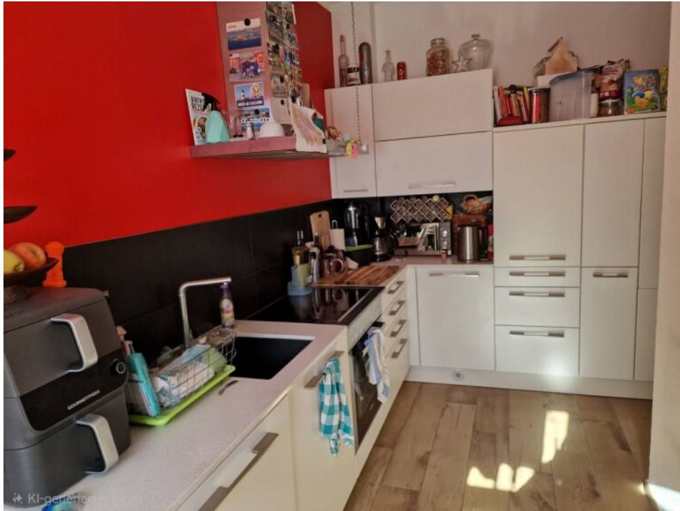
Küche - Anbau