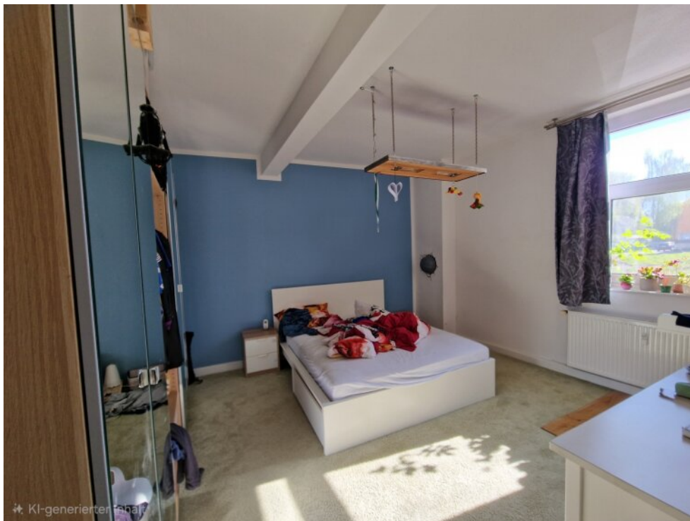
Schlafzimmer - Anbau