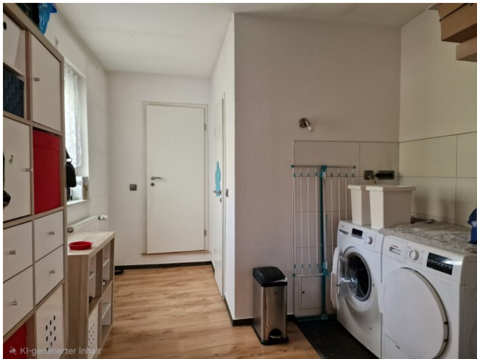
HWR - Anbau