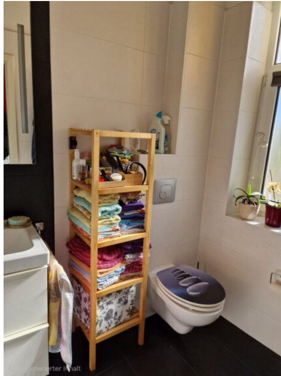
Bad - Anbau