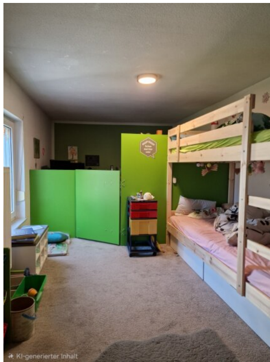
Kinderzimmer - Anbau