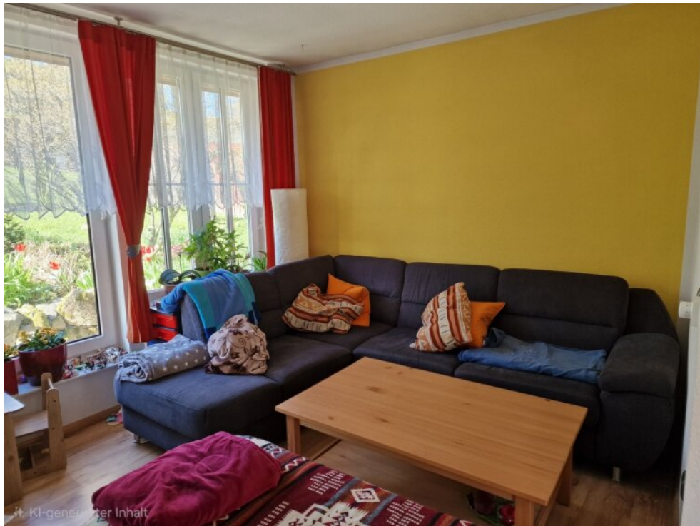
Wohnzimmer - Anbau