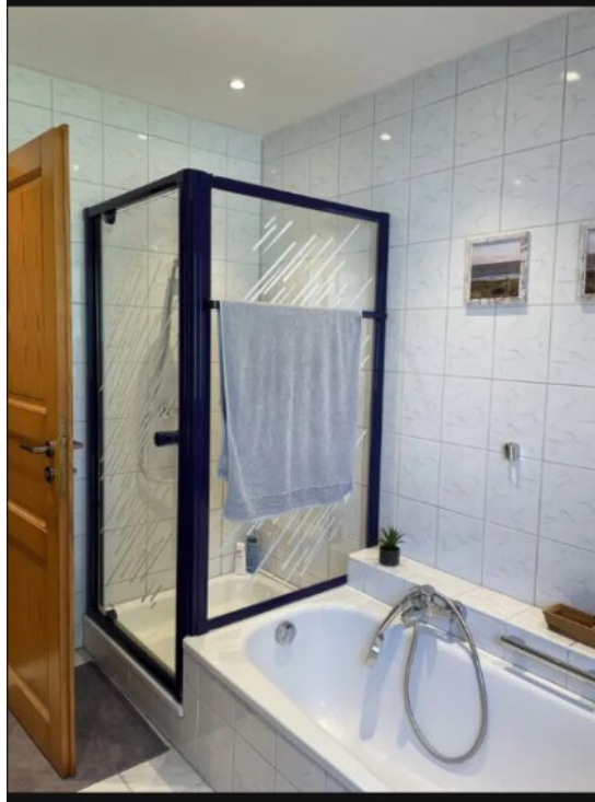
Dusche mit Wanne