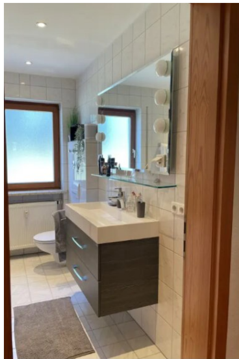
Bad Bild 1