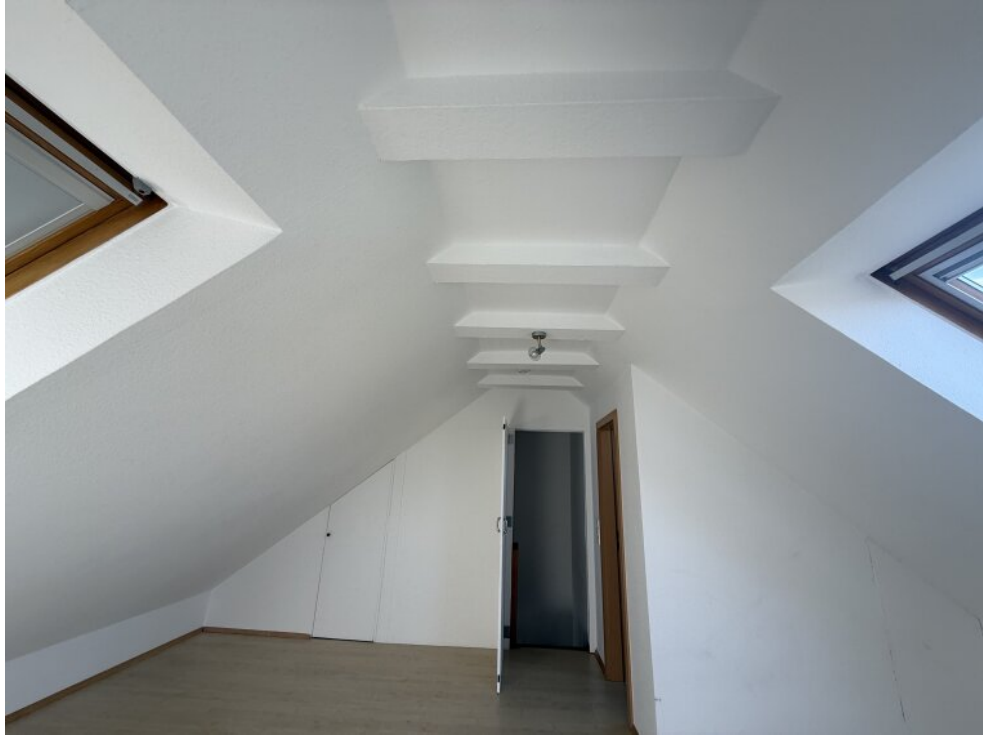
Firsthohe Ausführung Studio