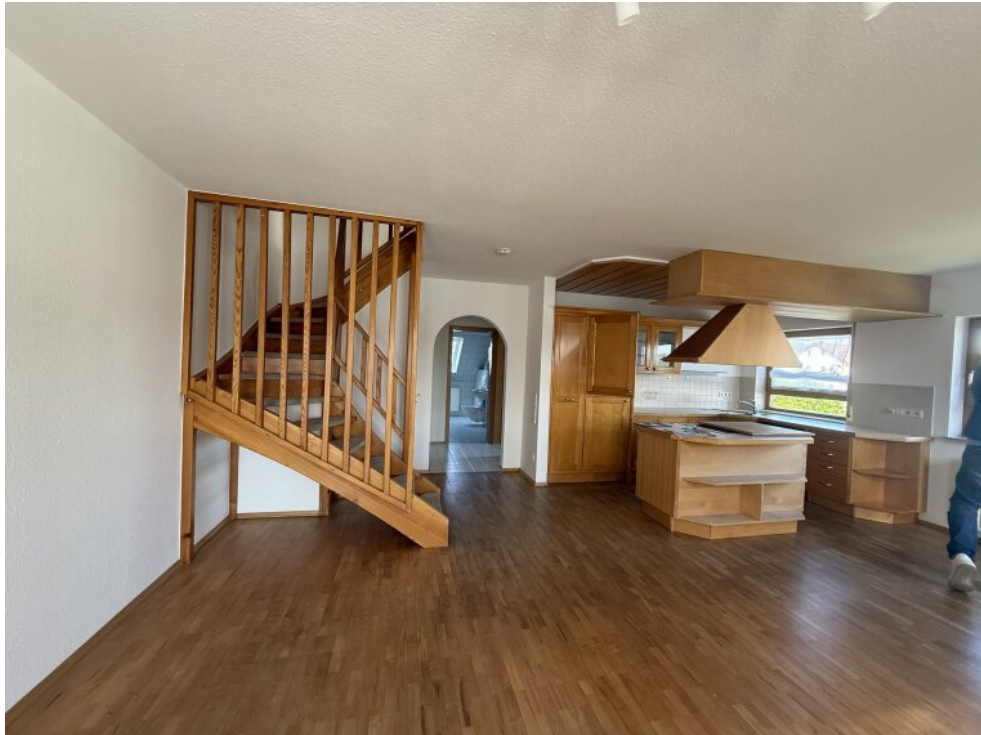
Küche mit Aufgang