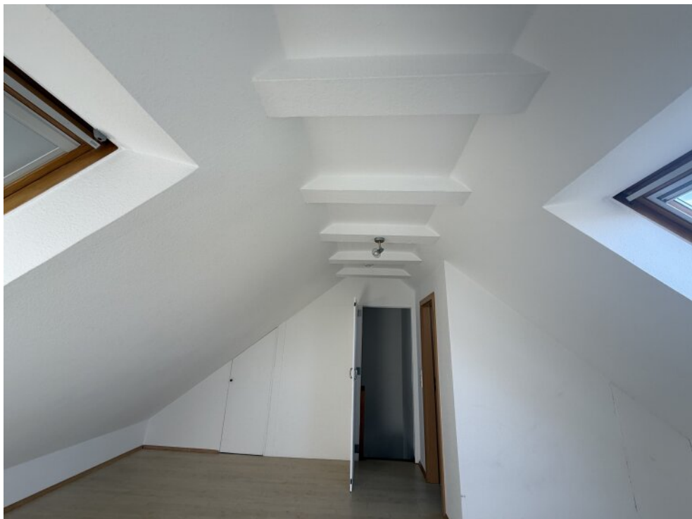
Firsthohe Ausführung Studio