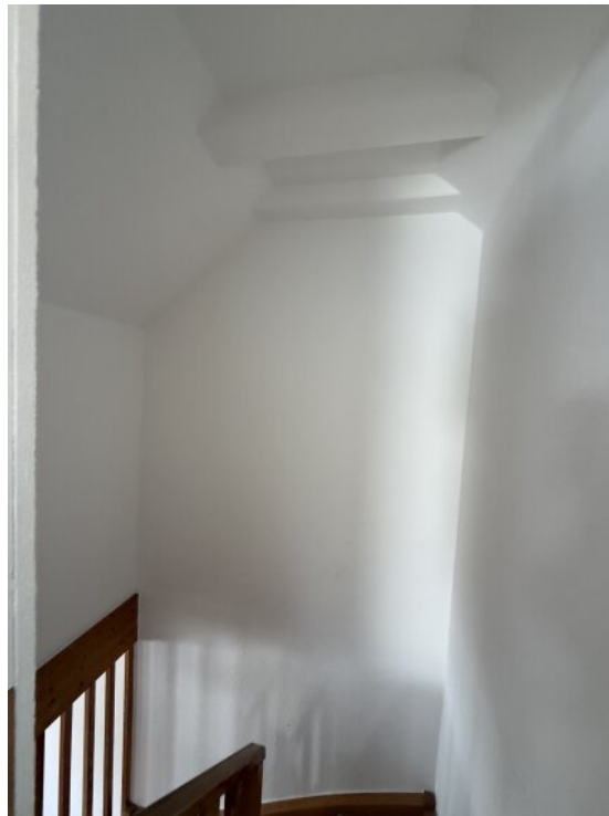
Firsthohe Ausf. Treppenaufgang