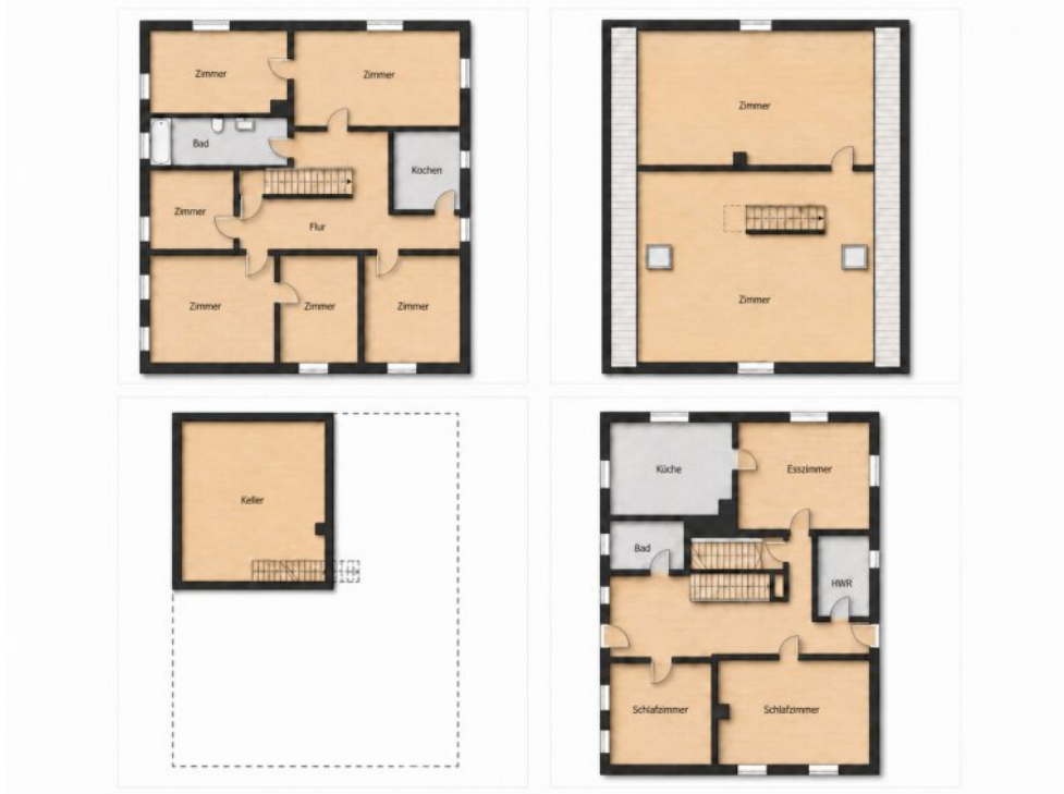
Grundriss nicht maßstabsgetreu