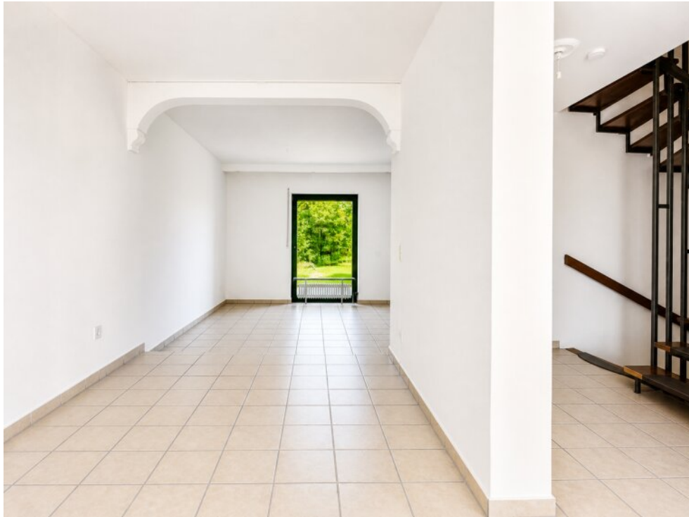
Blick vom Eingang