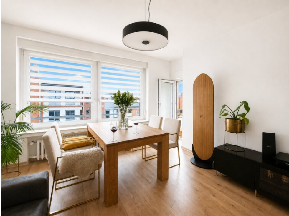
Wohnbereich mit Balkon