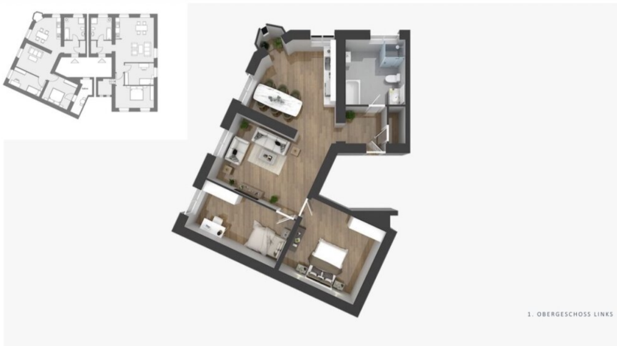
Grundriss 1.OG Links