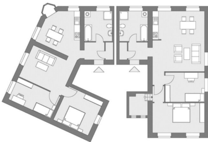
Grundriss 2. +3. OG