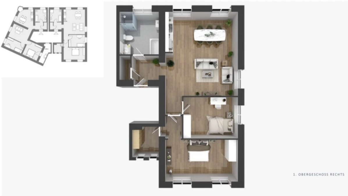
Grundriss 1.OG Rechts