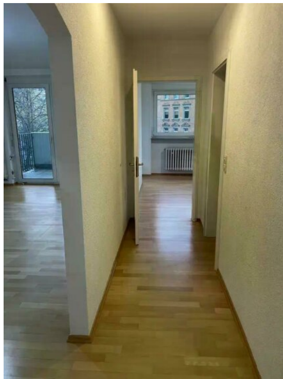
Flur zum Kinderzimmer