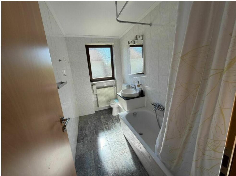
Erster stock Badezimmer