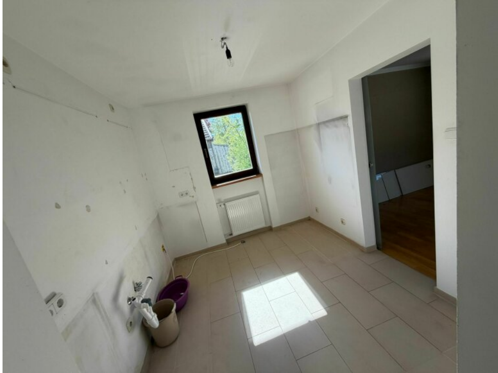
Erster stock Küche