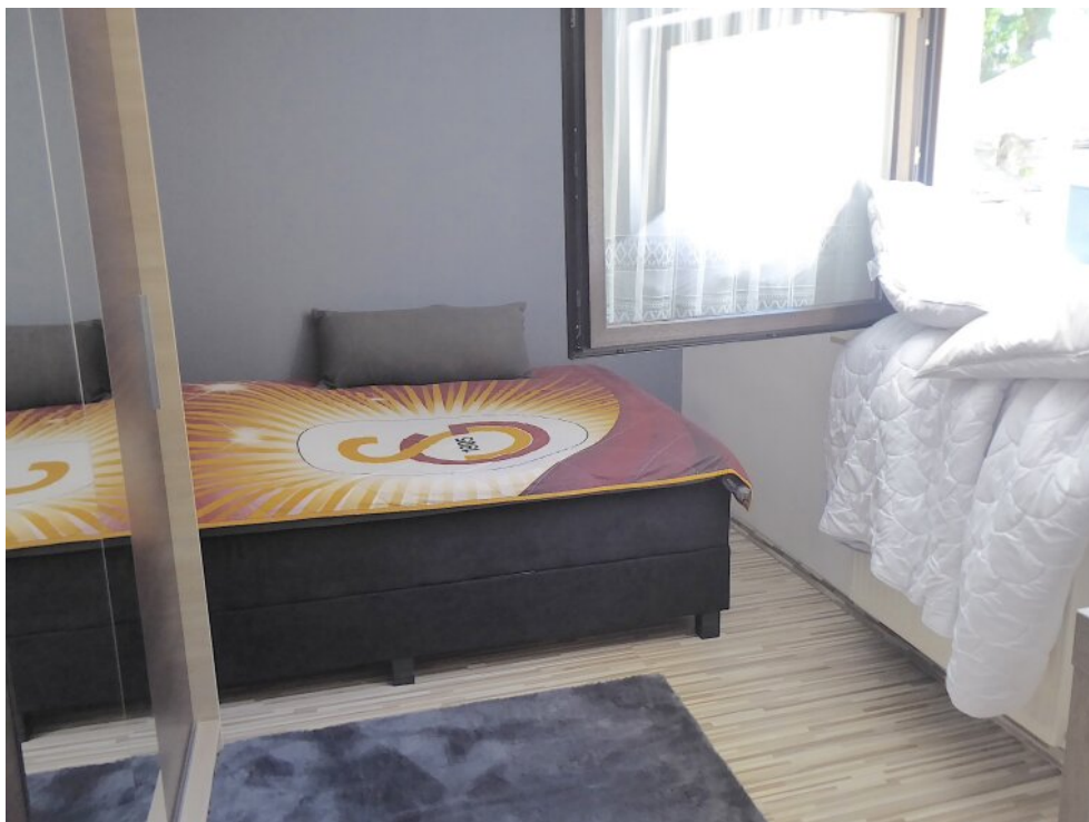
Kinderzimmer I im 1. OG