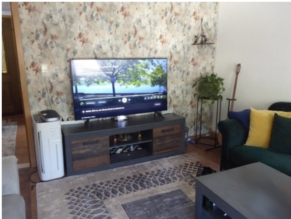
Wohnzimmer 2. OG