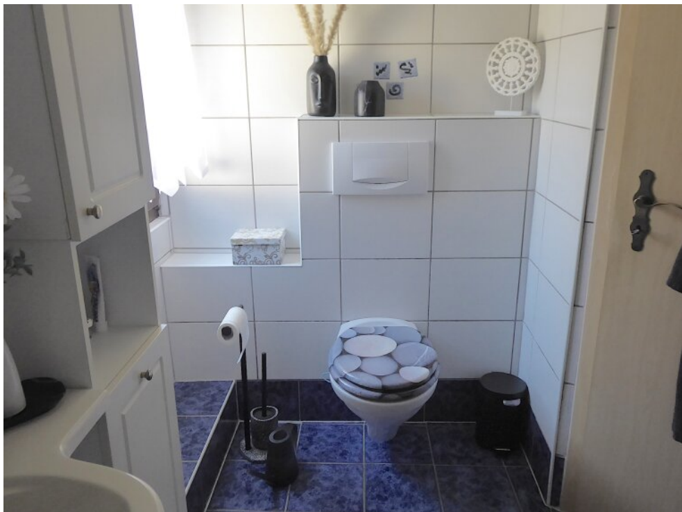
Tageslichtbad 1. OG