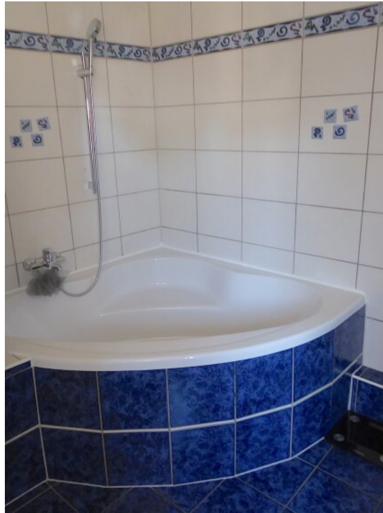
Eckwanne Bad 1. OG