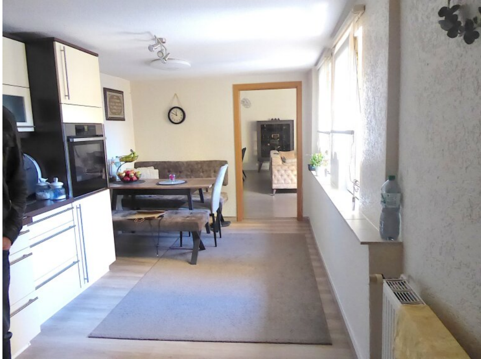
Küche mit Essplatz 1. OG