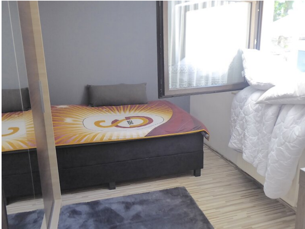
Kinderzimmer I im 1. OG