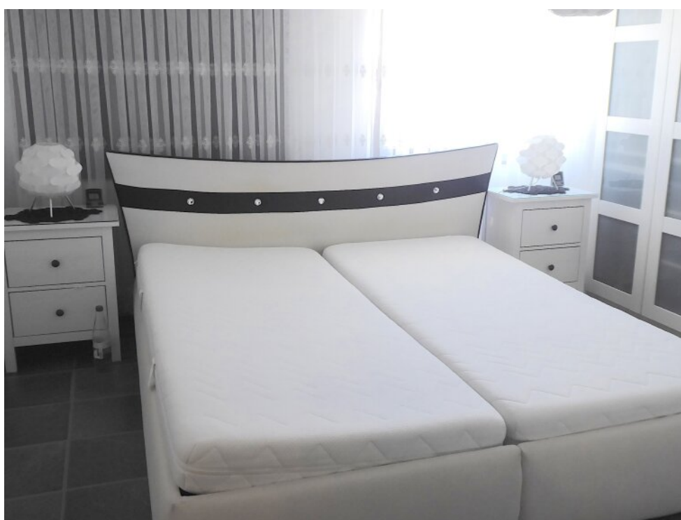
Schlafzimmer 1 OG