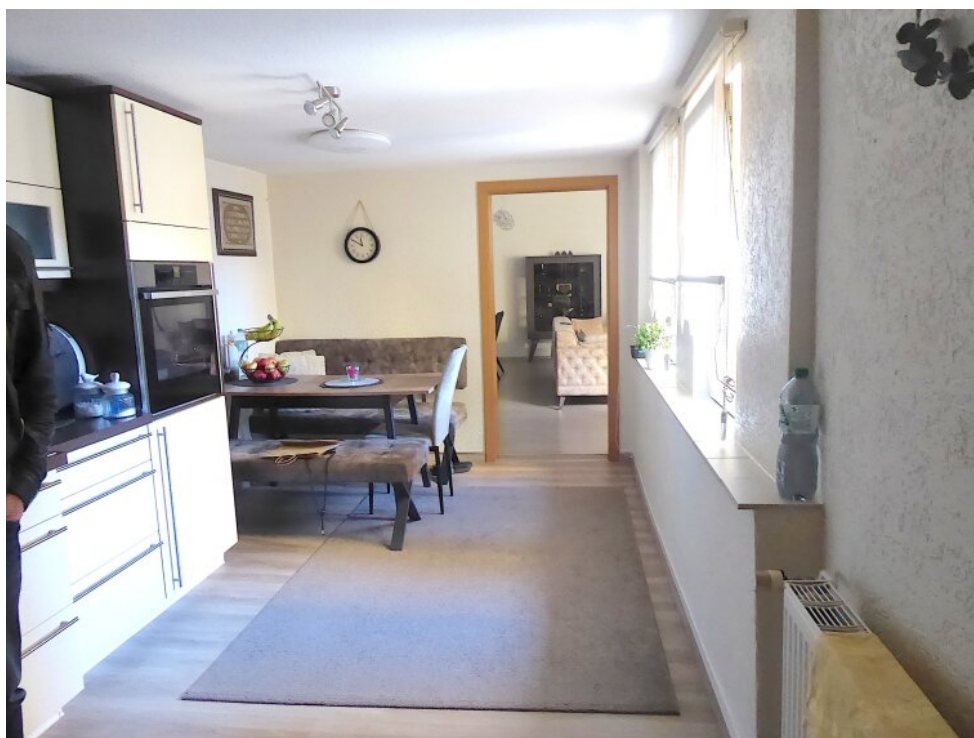
Küche mit Essplatz 1. OG