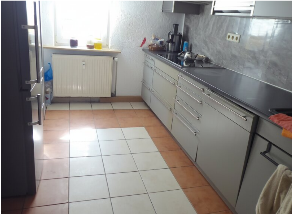
Küche 2. OG