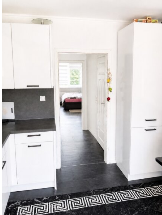
Esszimmer Durchgang Flur