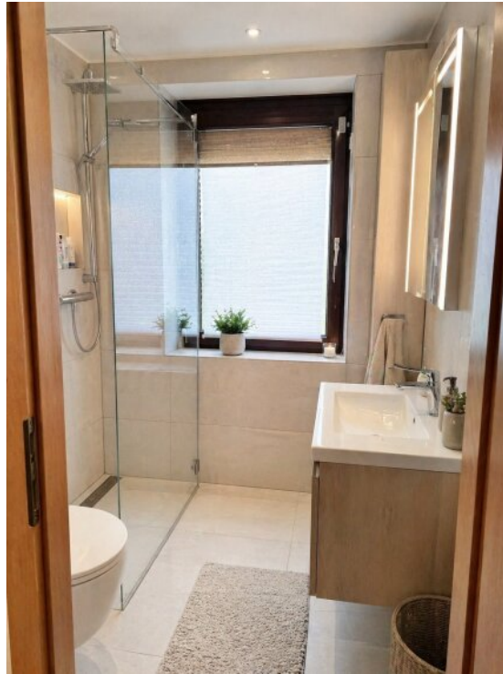
KI Ansicht Badezimmer