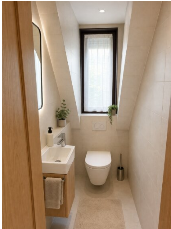
KI Ansicht WC DG