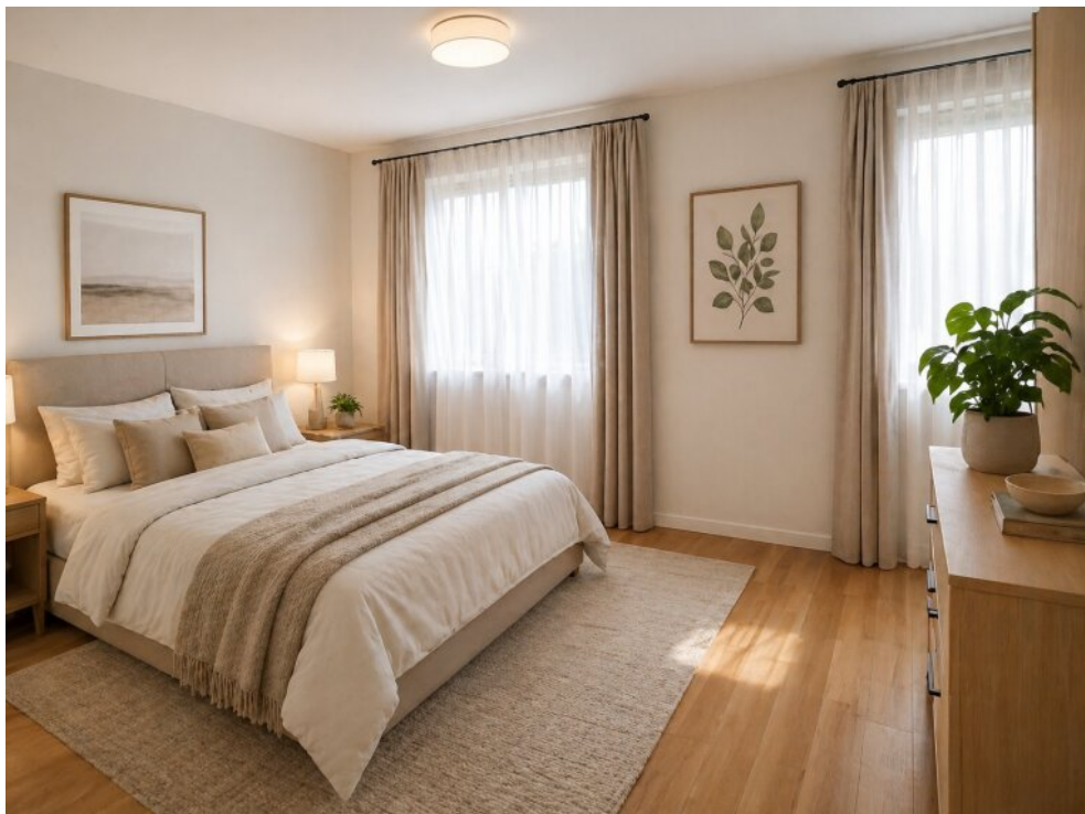
KI Ansicht Schlafzimmer