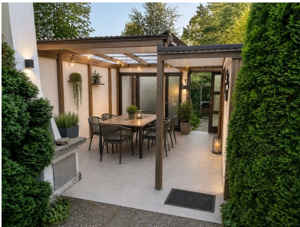
KI Ansicht Garten