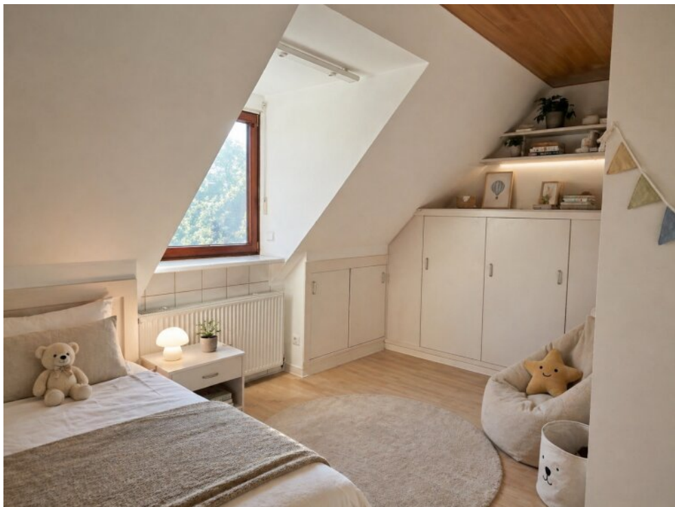
KI Ansicht Kinderzimmer