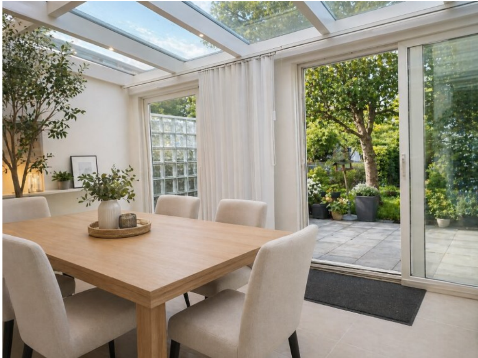
KI Ansicht Wintergarten