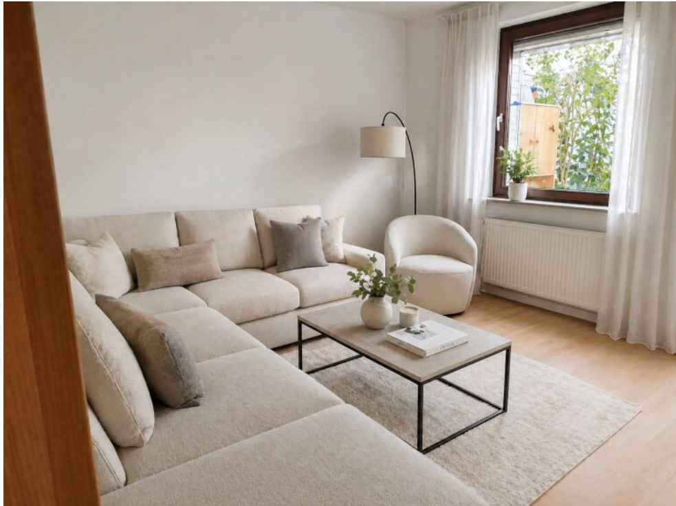
KI Ansicht Wohnzimmer