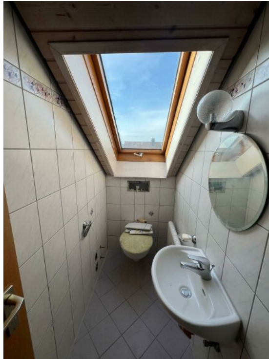
OG Gäste WC