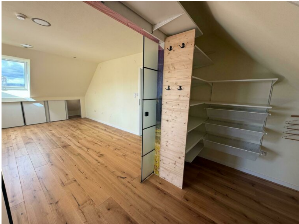
Schlafzimmer mit Ankleide