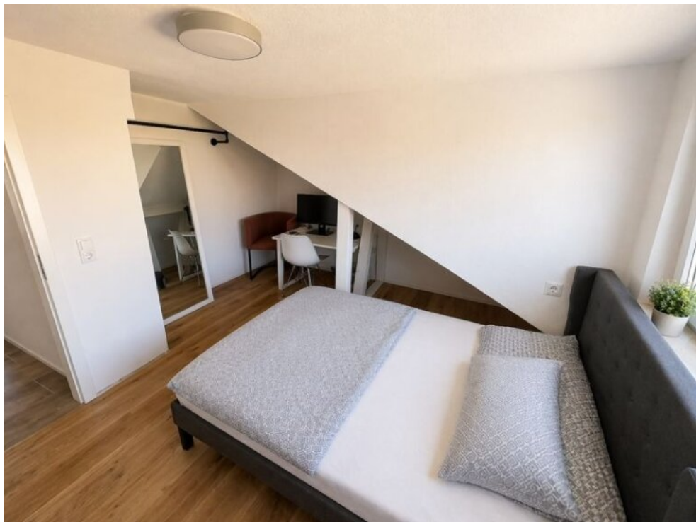
Kind Nr. 2