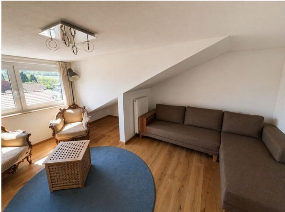
Kind Nr. 1