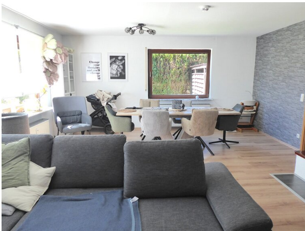
Wohn-Essbereich im EG