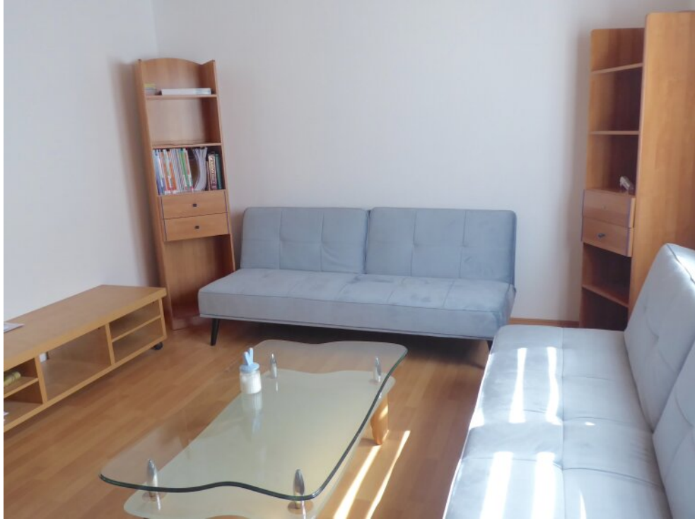
Wohnzimmer im UG