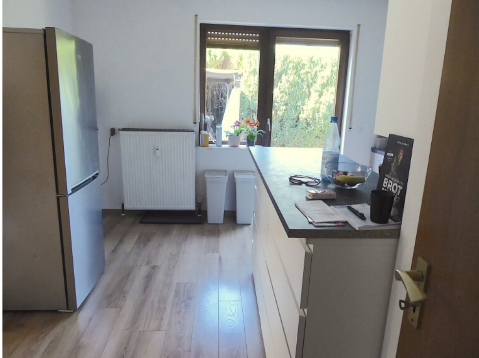
Küche EG mit Ausgang Garten