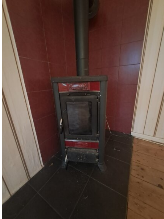
Kaminofen im EG