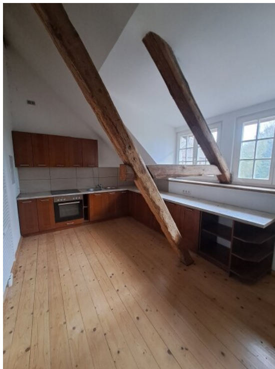
Offener Küchenbereich mit EBK