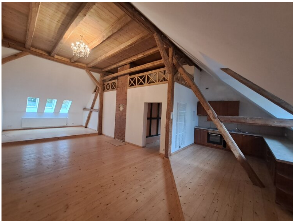
Wohnen und Küche