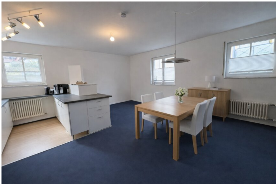
separate Wohnmöglichkeit mit Küche und Badezimmer