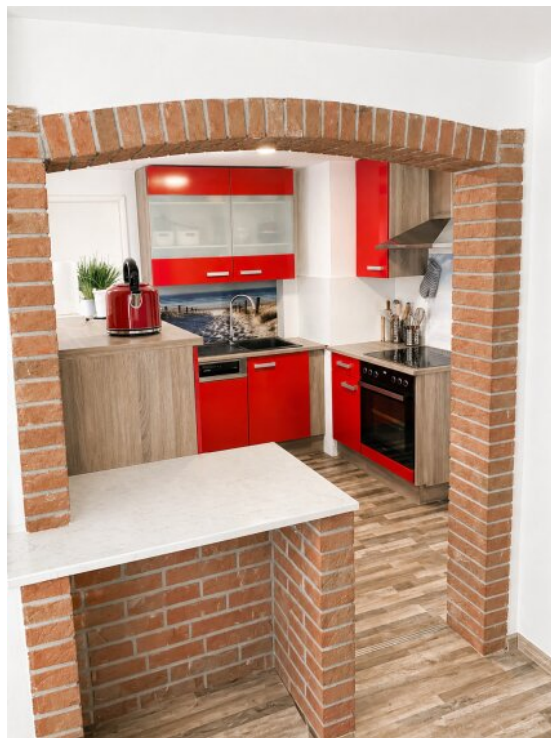
Küche Blick aus Esszimmer EG