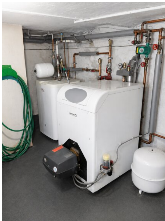
Heizung - aus 2018 -