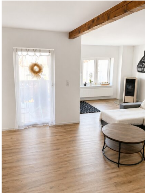
Wohnzimmer Zugang Balkon EG