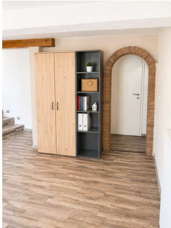
Büro EG Zugang Essbereich