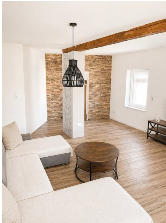
Wohnzimmer Zugang Büro