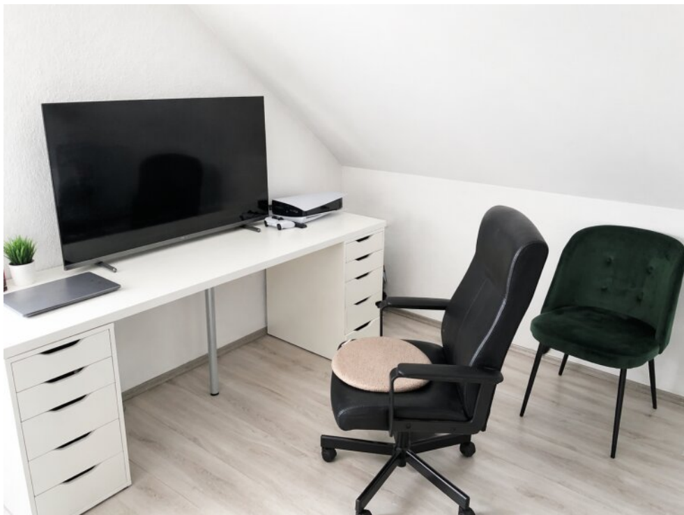
Büro/Schlafzimmer 1. OG