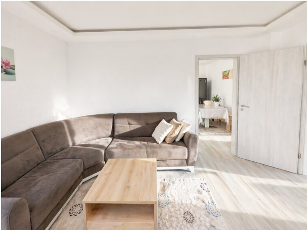
Wohnzimmer OG Zugang Esszimmer