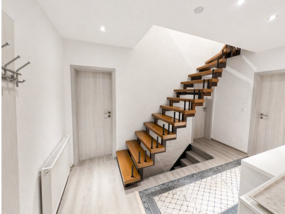
Flur OG Zugang 1. OG