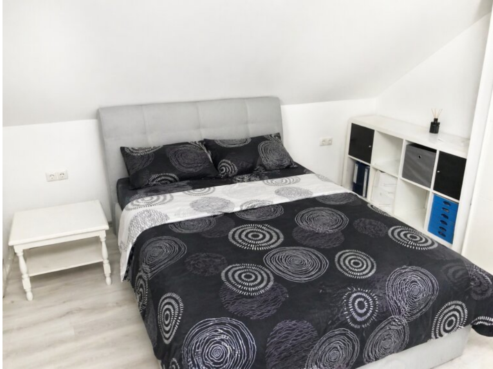
Schlafzimmer 1. OG