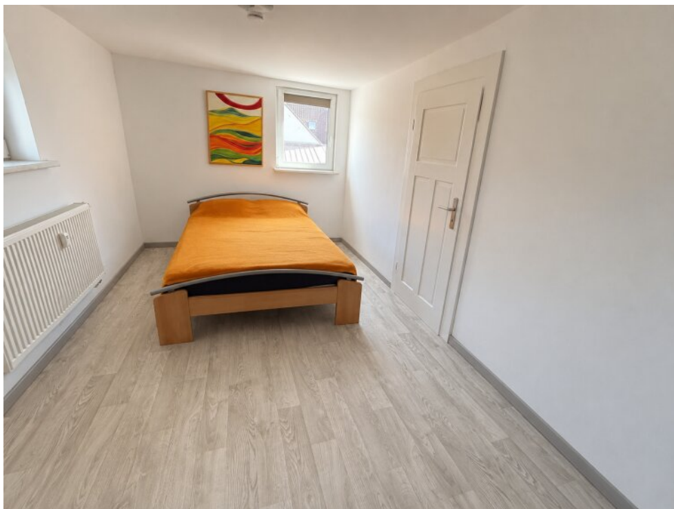
ChatGPT Image 21. Mai 2026, 11_22_13