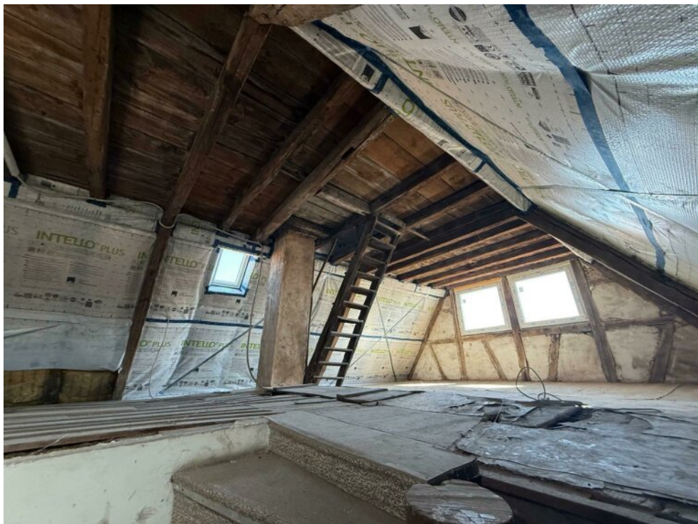
gedämmter, ausbaubarer Dachboden