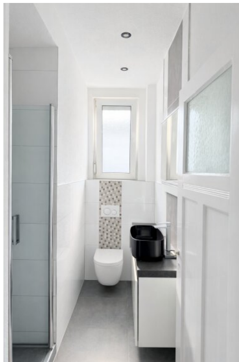
EG links Bad