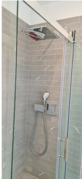
EG rechts Bad