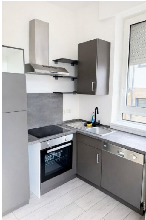
EG links Küche