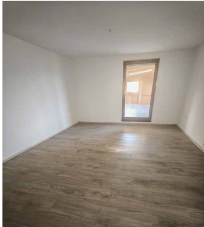
Zimmer mit Wintergartenzugang