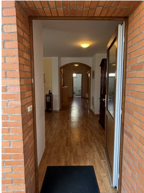
Eingang Souterrain Wohnung