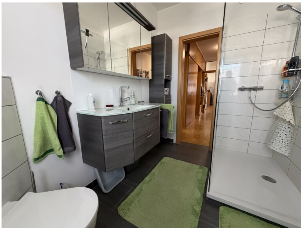
neues Bad (2019)