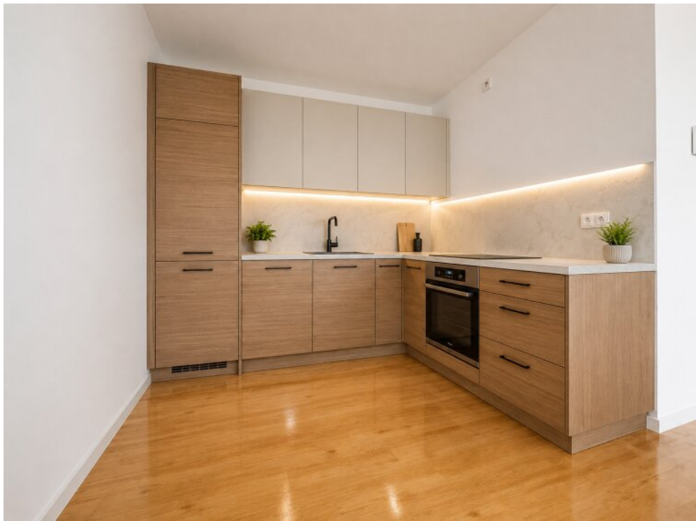
Musterbeispiel einer Küche