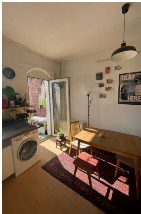
Küche mit Esszimmer