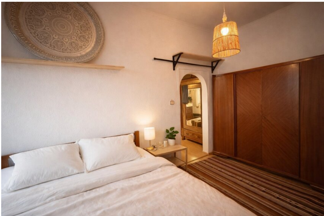
Schlafzimmer Blickrichtung WZ