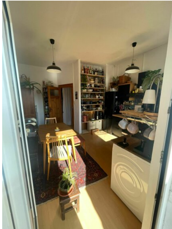
Küche vom Balkon