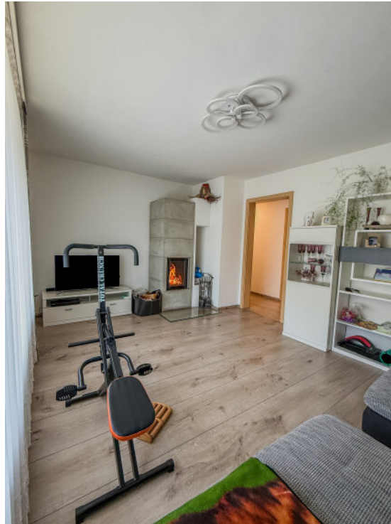
Wohnzimmer im EG