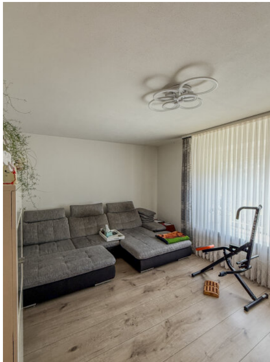
Wohnzimmer im EG