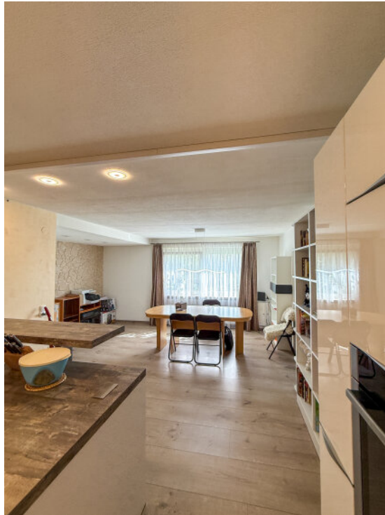
Esszimmer im EG