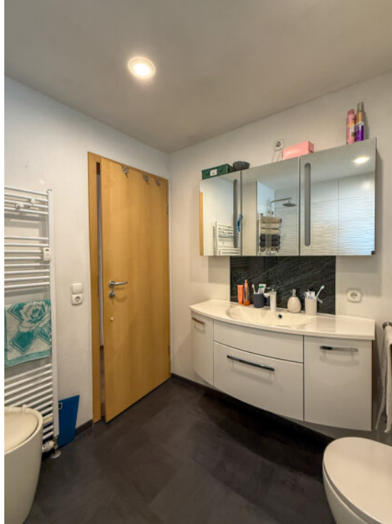
Bad im EG