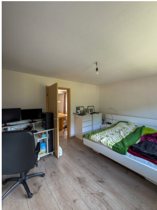
Kinderzimmer im EG