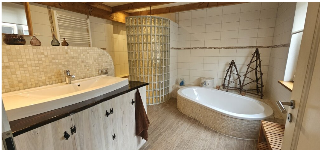
Großes Bad im EG