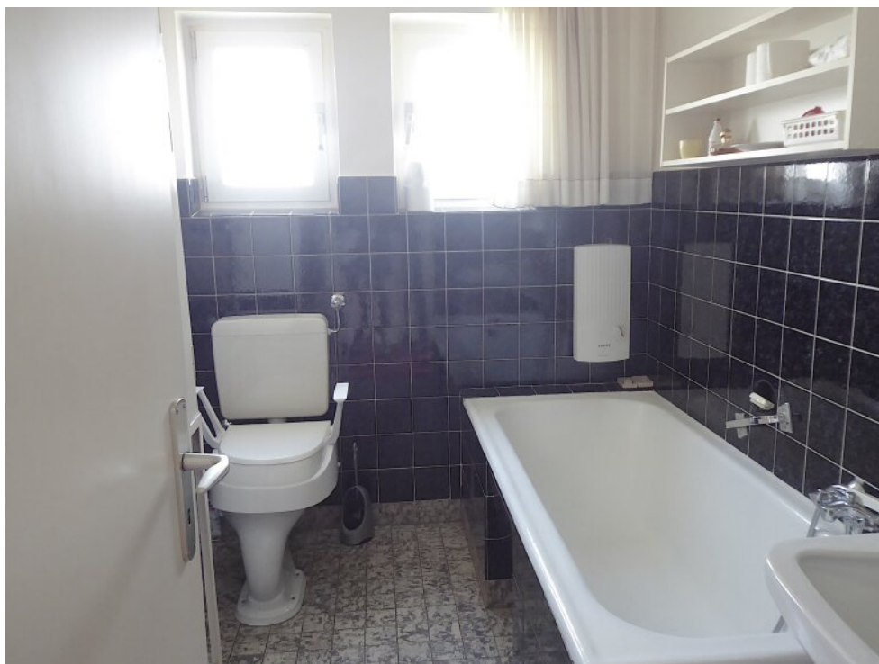
Tageslichtbad mit Wanne OG