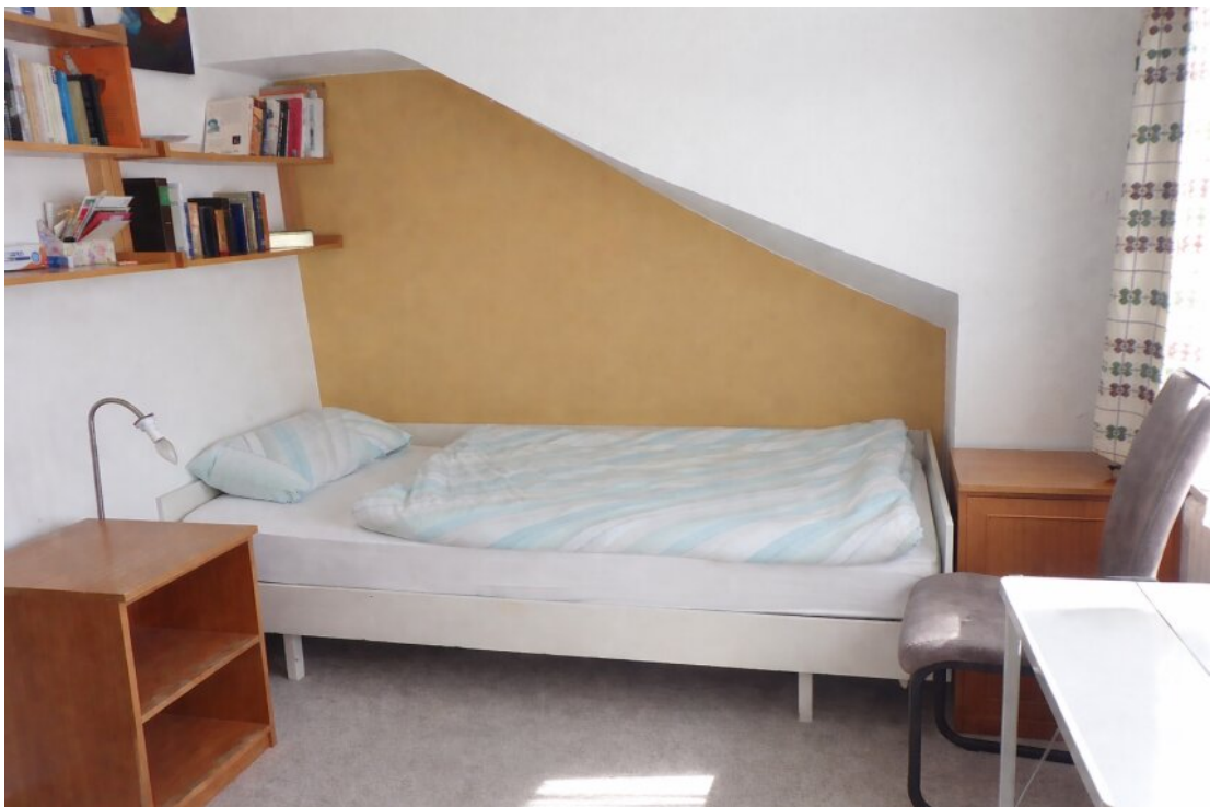
Kinderzimmer II OG