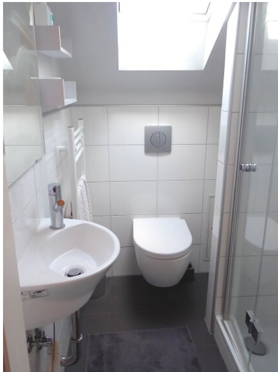
Tageslicht Duschbad im DG