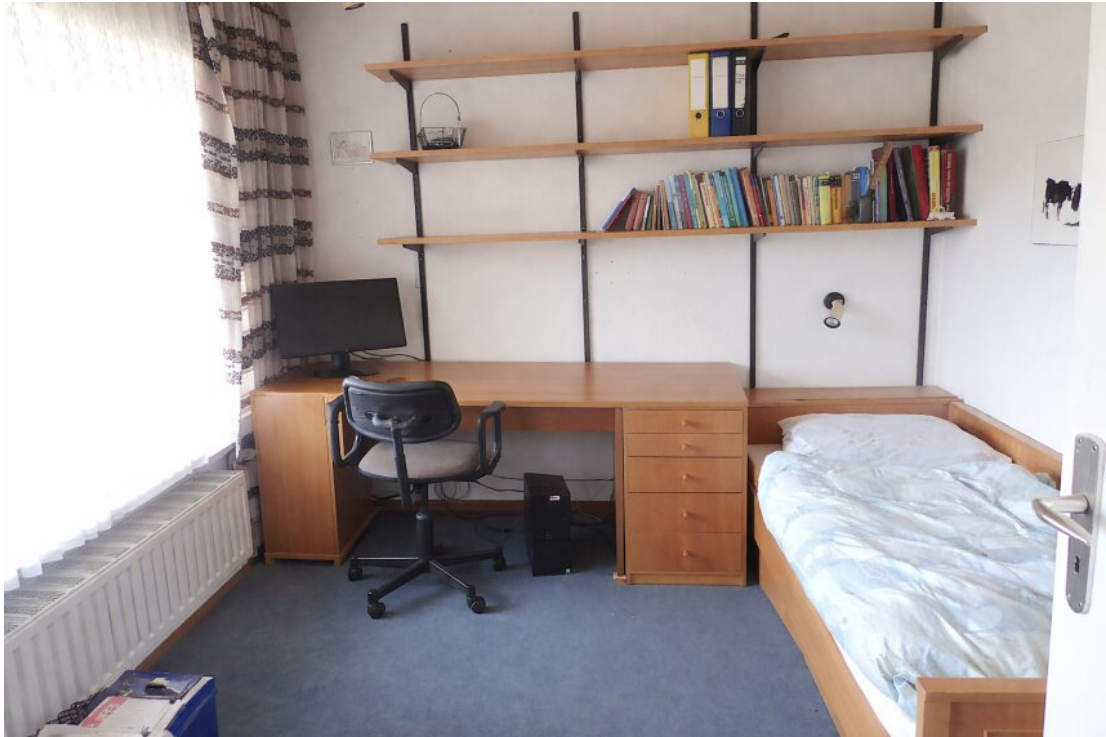
Kinderzimmer I OG