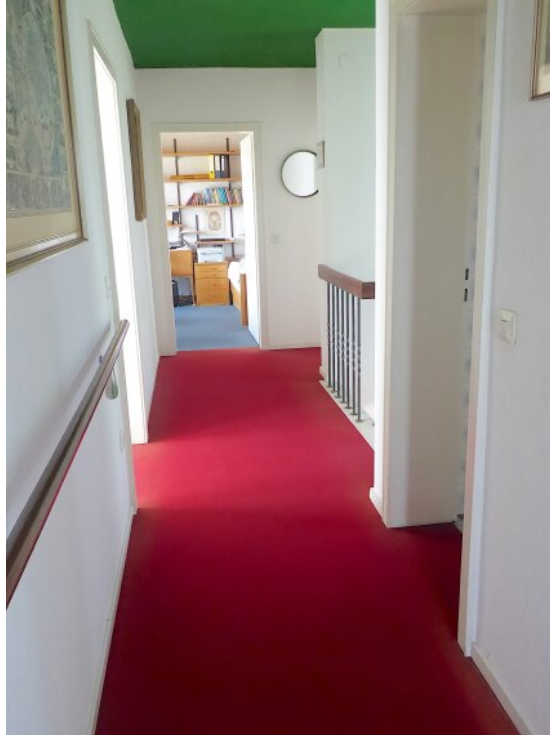
Flur im OG