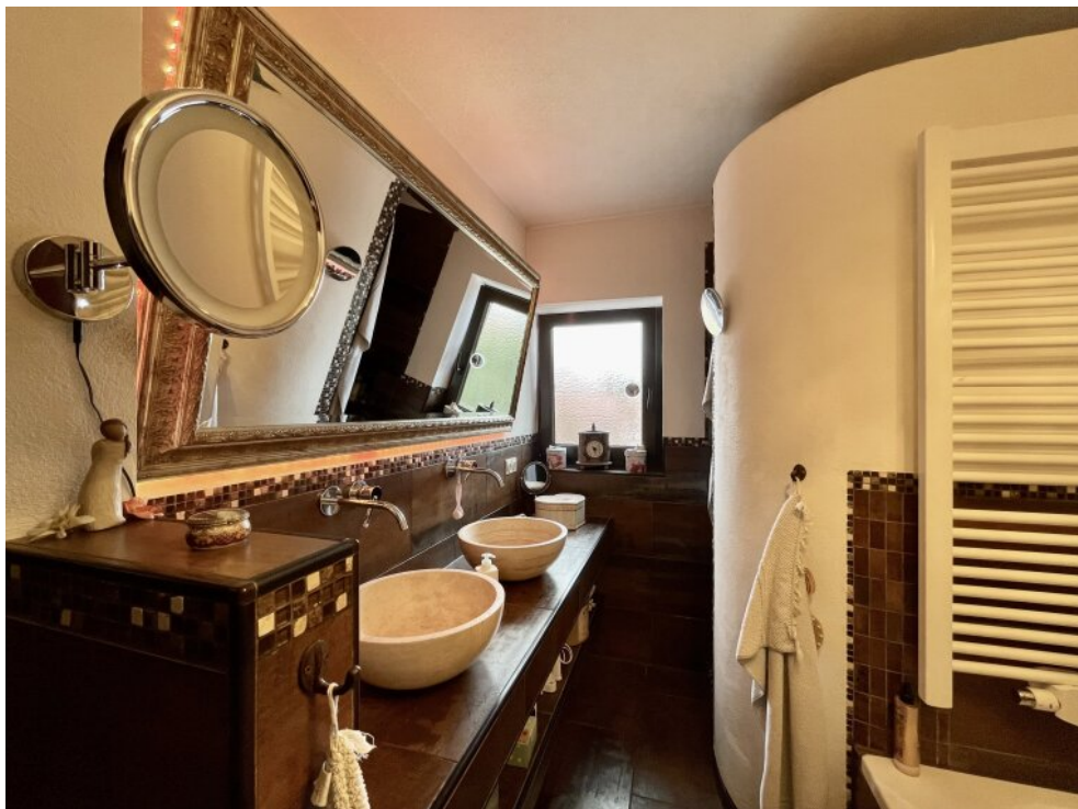
Bad mit Doppelwaschbecken