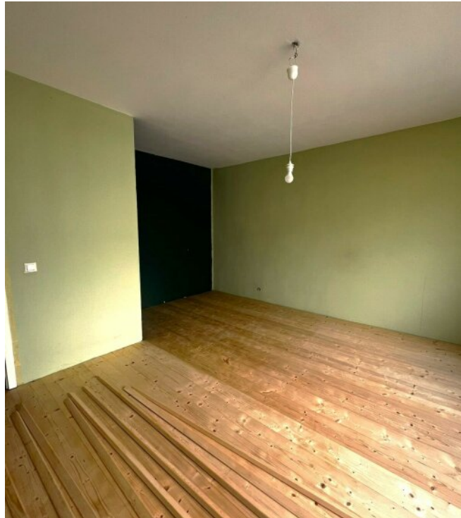
Eingang - Wohnen